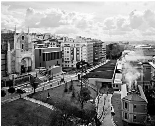
Vista general del actual Museo del Prado. A la derecha, Edificio Villanueva. A la izquierda, en alto, Iglesia y Edificio Jerónimos (“Cubo de Moneo”).

Gran preocupación ha venido siendo en todo momento para la Dirección de este Museo la urgente necesidad de espacio que ha tenido siempre esta institución. Por fin, desde el año 2007 cuenta el Museo con la suspirada ampliación. Se optó por aprovechar el inmediato Claustro de los Jerónimos, para lo que éste último pasó a manos del Ministerio de Cultura, recibiendo a cambio su dueño, el Arzobispado de Madrid, el compromiso ministerial de construir un edificio anexo a la Iglesia del monasterio y restaurar el templo. Del proyecto de restauración se hizo cargo el prestigioso arquitecto Rafael Moneo, que inició su trabajo desmontando piedra a piedra el Claustro. A continuación construyó un edificio al lado de la Iglesia de los Jerónimos, con un amplio recinto de acceso y dos plantas superpuestas de nueva construcción. Cada una de estas dos plantas está formada por dos grandes salas (A y B, 1ª planta; C y D, 2ª planta), destinadas a acoger magnas exposiciones temporales. En el año del II Centenario del Museo (2019), las salas A y B han venido exhibiendo la exposición temporal “Velázquez, Rembrandt y Ver-