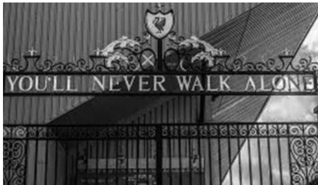
Estadio de Anfield, Liverpool

Es una antigua conocida mía, de ahí mi emoción cuando alguien la nombra. Era yo profesor de lengua española y presidente de su Spa-