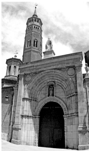
Iglesia de San Pablo.

¡Cómo han pasado los años!, ¡O tempora, o mores!