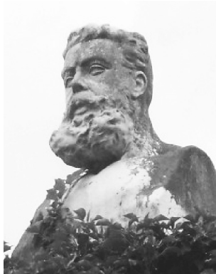
J. Costa, obra de D. Lasuén (1916)

debemos recordar que se descubrió una placa a Joaquín Costa en su casa natal, en 1989, cuya placa en nuestros paseos por la ciudad montisonense en los últimos años no hemos podido apreciar. ¿Habrà sido capaz el Ayuntamiento de Monzón de cambiar el emplazamiento sin tener la cortesía de comunicárnoslo?