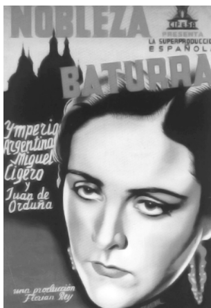
Cartel de la película «Nobleza baturra»