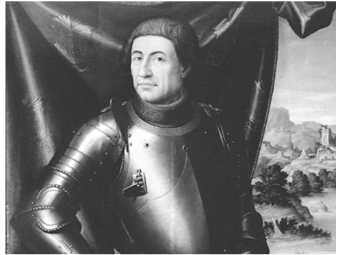
Alfonso V el Magnánimo

guera por orden de Clemente VIII por opinar que «la religión debe ser entendida como una ley destinada al gobierno de masas populares incapaces de regirse por la razón»; Campanella, filósofo de la utopía, autor de «La ciudad del sol»; o el médico Giuseppe Moscati proclamado santo en 1975 por Pablo VI, con una capilla en el Gesú rebosante de exvotos: en bronce, con bata y fonendoscopio, su gran estatua muestra una mano brillante remodelada por los besos de los fieles.