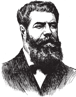
Joaquín Costa Martínez

Es curioso, que en su última etapa, allá por el año 1908, se dio cuenta con mucha rabia, que los votos no reflejaban la verdad de la voluntad popular. También es muy hermosa la frase que dice: «Soy dos veces español porque soy aragonés».